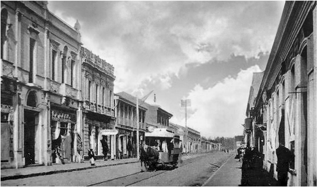
Calle Roble, Chillán, 1910.