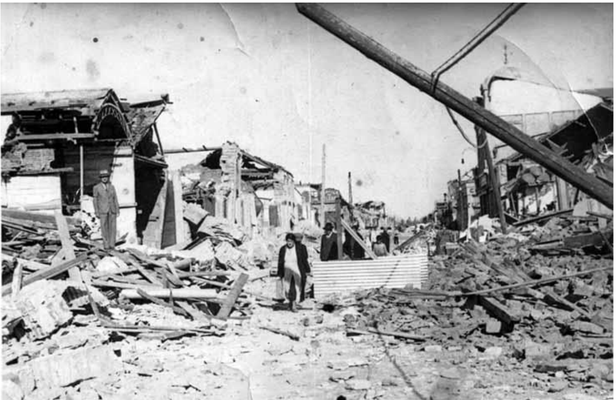
Calle Roble, Chillán, January 1939.