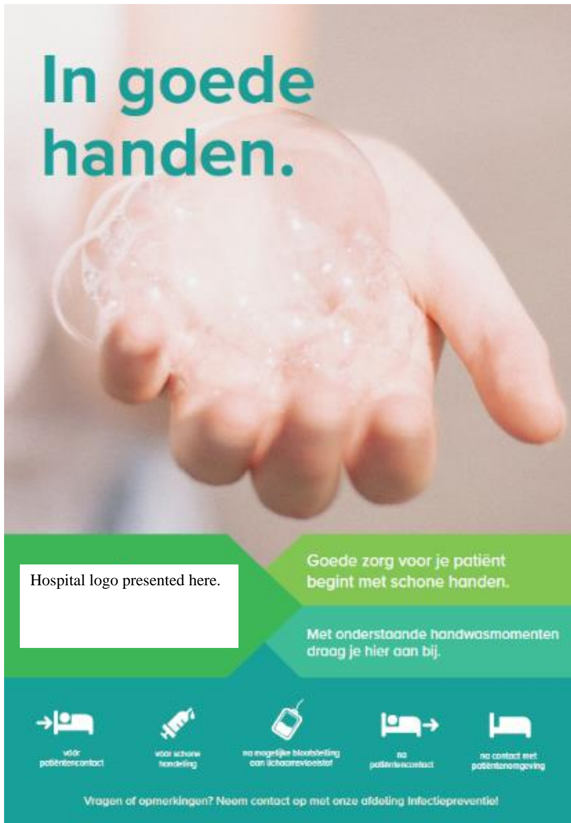
Image A2.1: the layout of the poster and the flyer for the nudging intervention.